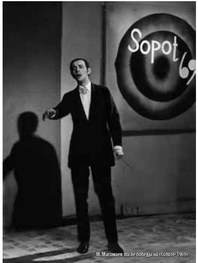
М. Магомаев после победы на «Сопоте-1969».

Обратившись же к песенному творчеству советских композиторов, он безраздельно воцарился на эстраде огромной страны, привнес на неё высочайшую музыкальную культуру и завоевав сла-