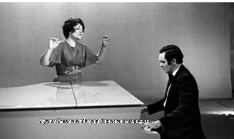
Муслим Магомаев и Тамара Синявская на концерте...

Муслим Магомаев любил повторять, что он по роду профессии певец, а всё остальное, чем он занимается, это всё хобби – «отдых для души». Не знаю, прав ли он. Считаю, что достижения в живописи столь же высоки. Говорят, глаза – зеркало души человека. Так вот, когда смотришь на портрет Верди, написанный Магомаевым, создаётся ощущение, что через глаза этого великого итальянца смотрит на тебя весь XIX век Италии с её борьбой за единое государство, со звучащей в народе умопомрачительной по воздействию музыкой гениального итальянского композитора.